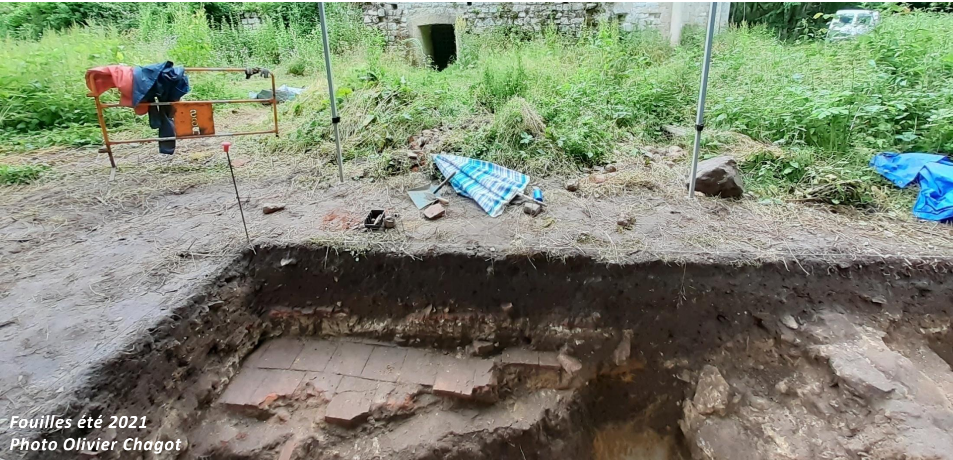
Fouilles été 2021